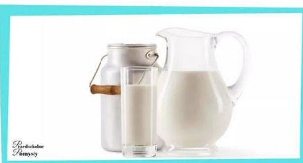
Przebieganie Tomysy Mleko przerabiane jest na śmietanę. Następnie śmietana poddawa jest procesowi pasteryzacji i schładzania