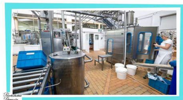
Przebieganie Tomysy Mleko trafia do mleczarni, gdzie jest przetwarzane na różne mleczne produkty.