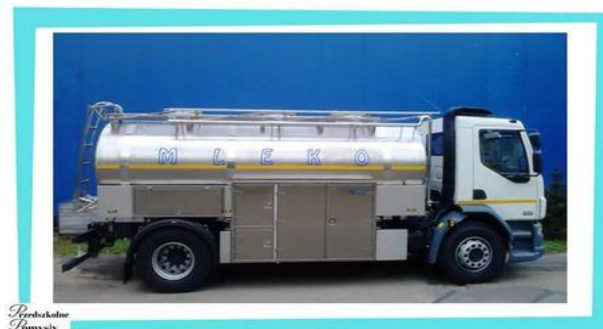
Przebieganie Tomysy Po mleko przyjeżdża codziennie cysterna.