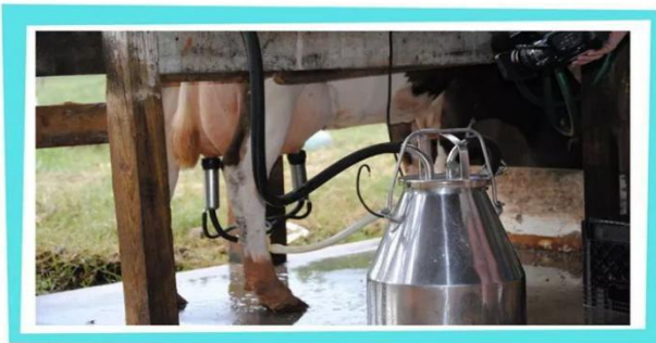
Przebieganie Tomysy Codziennie doją je maszynowo.